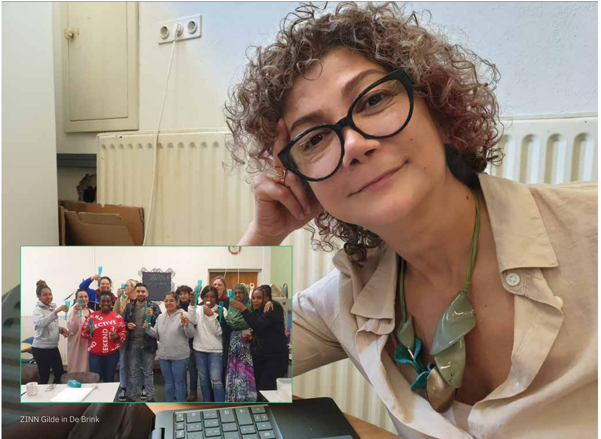
ZINN Gilde in De Brink