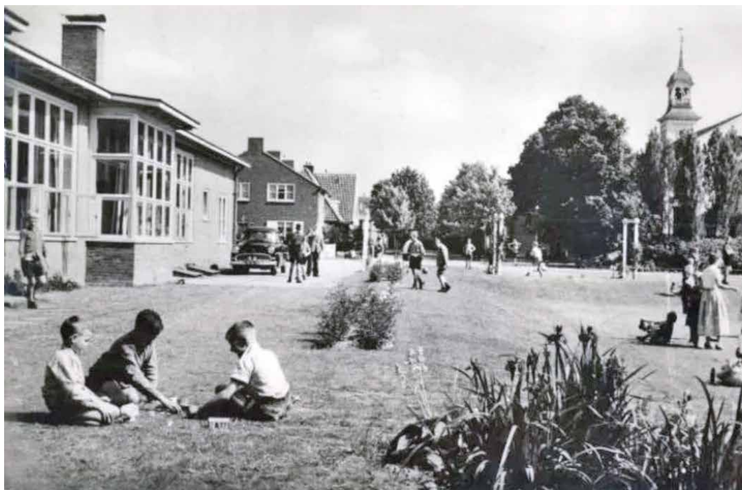
Impressie van het kindertehuis waar hij vroeger woonde.