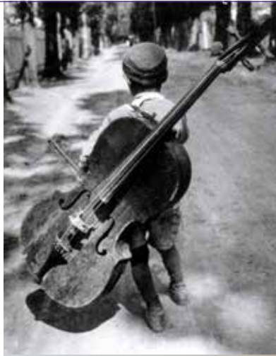
Hongaars zigeunerkind met cello (1931)