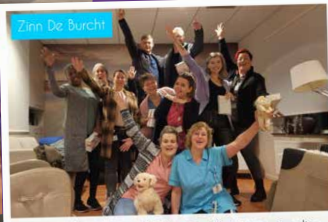
Pg laagbouw wenst jullie een fijne jaarwisseling