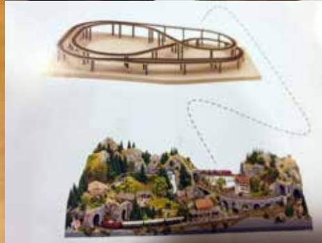
Sporbaan in aanbouw...