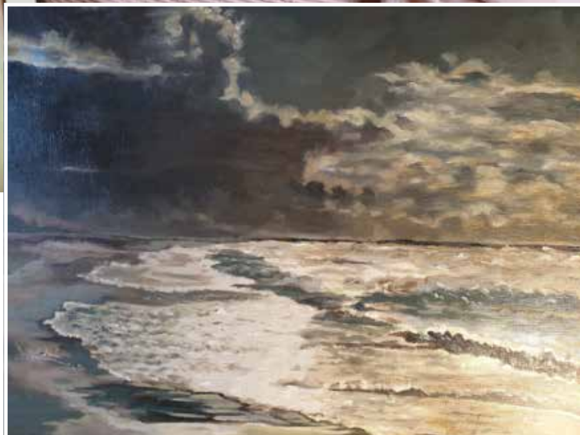
Geschilderd met haar overleden zoon in gedachten...

In Den Anel nam het paar een cafetaria over. Ze zegt: “Ik bakte patat en braadde de kippen, het was een goede tijd.” In het