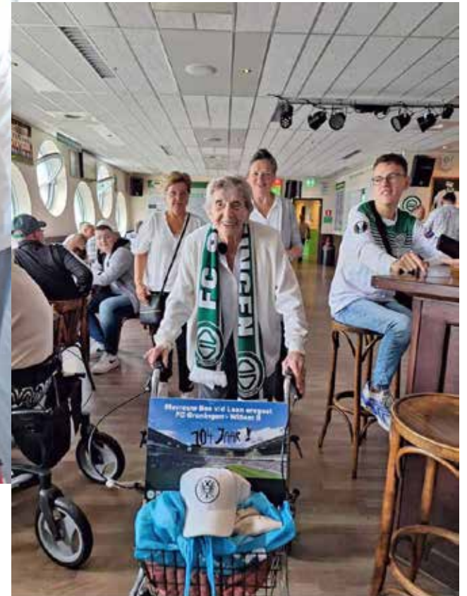
En even een rondje door het supportershome.