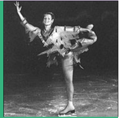
Zo moet Puk gewerkt hebben in de jaren 60. Een foto van haarzelf kon ze helaas niet meer terugvinden...