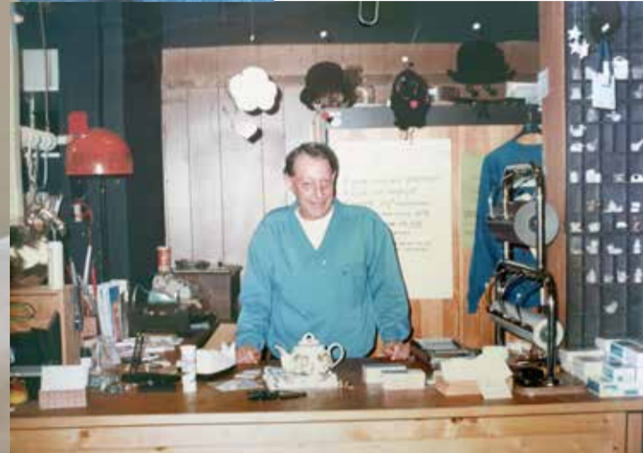
Trotse winkelier (1988)