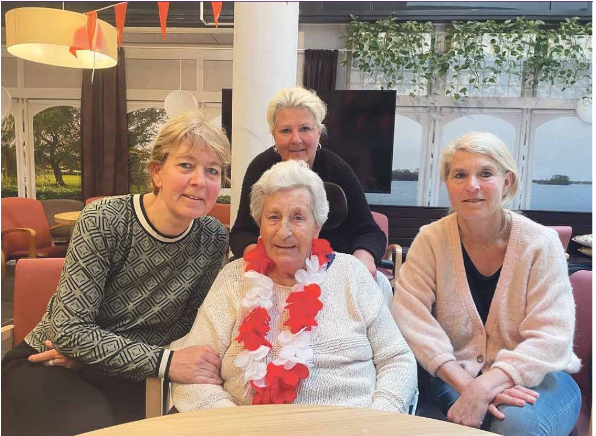
De drie dochters omringen hun moeder met liefde. De zoon van Ali staat niet op de foto.