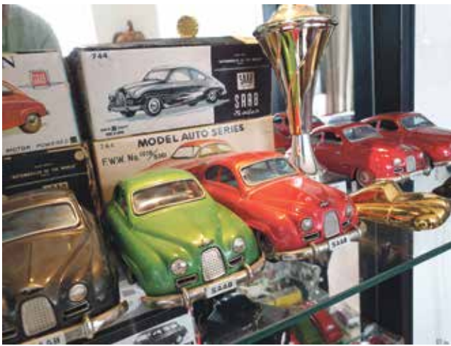
Auto's in vitrine, de oude modellen van Saab.