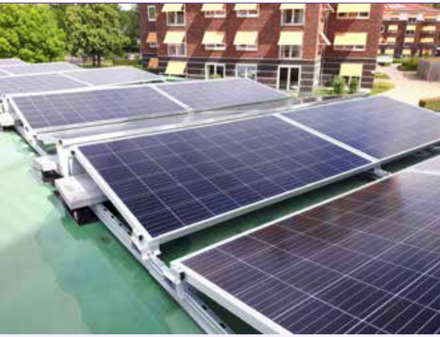
Zonnepanelen op de Dilgt in Haren. Op de vier grote gebouwen van ZINN staan in het totaal 1050 zonnepanelen.